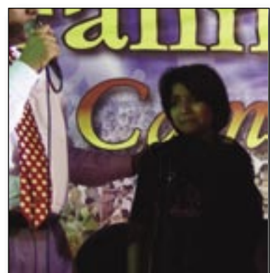
Befreit von Dämonen