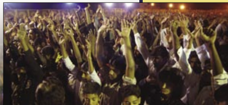
Entscheidung für Jesus