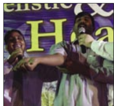
Arm war gelähmt

„Und Jesus sprach zu ihnen: Folget mir nach, ich will euch zu Menschenfischern machen!“ Matthäus 4,19