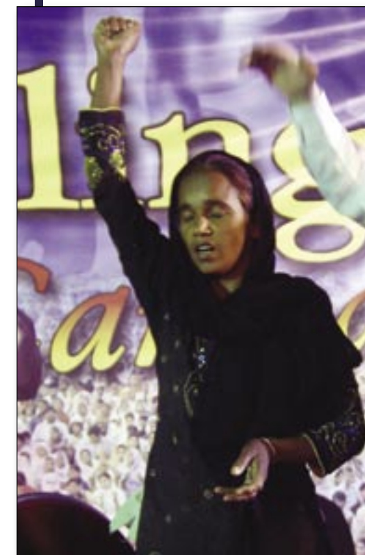
Nach 20 Jahren keine Nierensteine mehr