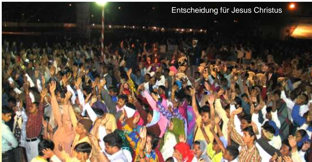
Entscheidung für Jesus Christus

Ein Pastor wagte es, vor seinem Haus ein Plakat mit der Bekanntgabe der Evangelisation aufzustellen. Er berichtete mir, dass er dauernd Anrufe von Moslems erhielt mit der Frage: