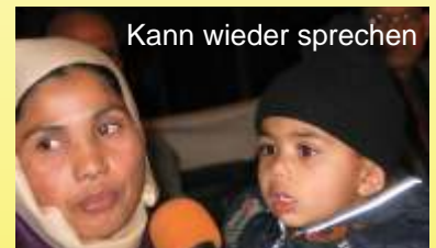
Kann wieder sprechen

Der Herr wirkte zudem in wunderbarer Weise: Eine Mutter brachte ihren vierjährigen Sohn nach vorne, der von Geburt an taubstumm gewesen war . Vor den Augen aller Versammelten fing er an, „Mama“ und „Papa“ zu sagen und reagierte auf unser Sprechen, was deutlich machte, dass er auch hören konnte. Seine Mutter gab unter Tränen Jesus alle Ehre! Ein Vater brachte seinen ca. zwölfjährigen Sohn nach vorne, der unter Epilepsie mit täglich Anfällen gelitten hatte . Der Vater ließ gleich am ersten Abend der Evangelisation für ihn beten, und am letzten Abend bezeugte er die vollständige Heilung seines Sohnes!